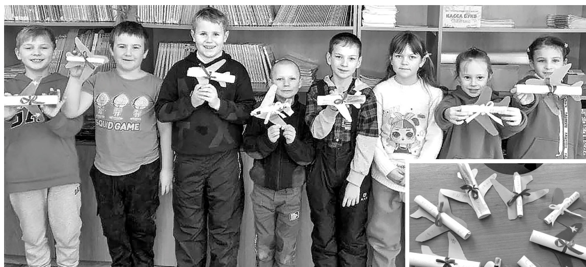
Ученики Степновской школы изготовили обереги-значки и открытки-самолетики с пожеланиями для солдат