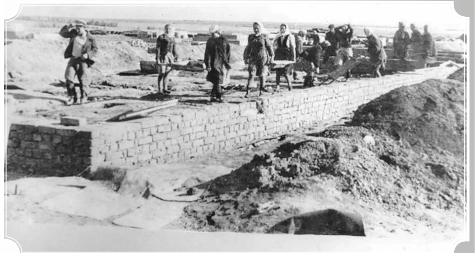
Начало строительства села Центральное, 1954 год