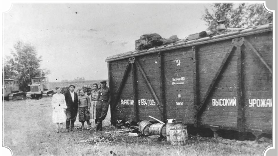
Одна из бригад совхоза «Первомайский», 1954 год