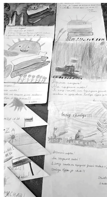
Страницу подготовила Ольга КОЛМАКОВА.